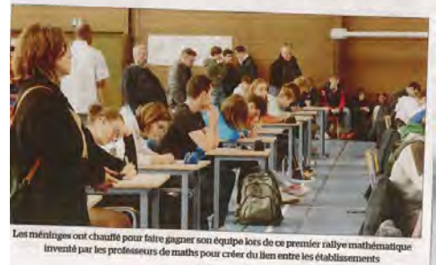
Les méritages ont chauffé pour faire gagner son équipe lors de ce premier rallye mathématique inventé par les professeurs de maths pour créer du lien entre les établissements

A l'issue des épreuves, l'équipe Bezout a remporté ce premier rallye, lmitée en individuel par Adrien pour les classes de 3 ème et Adèle pour celles de seconde.