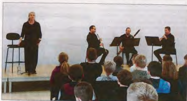
Journée découverte de l'opéra pour l'ensemble des élèves des classes de 6 ème du collège Bobée dans le cadre de l'opération "Contes en musique"