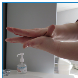
paume contre paume