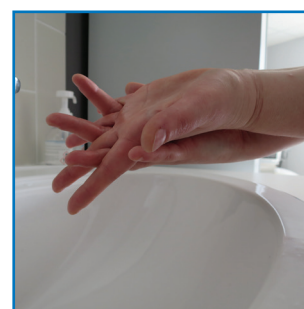
les doigts entrelacés