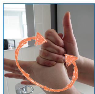
le côté des mains et les pouces